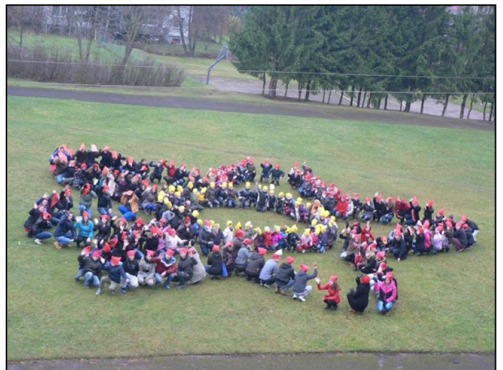
Mūsų Tolerancijos gėlė