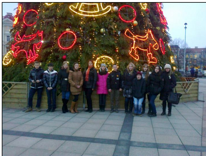
Katedros aikštėje prie šventinės eglutės

Ši išvyka padėjo užmiršti kasdienius rūpesčius ir pajusti artėjančių švenčių nuotaiką.