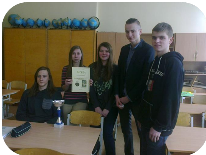
Literatūrinio žaidimo laimėtojų – vienuoliktokų - komanda