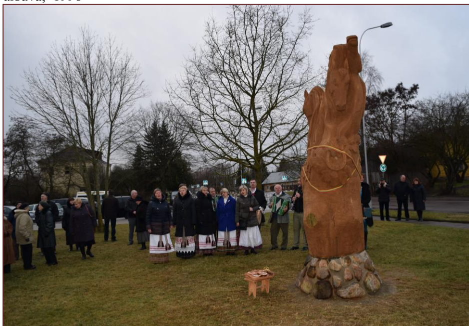
skulptūros simbolinio atidengimo akimirka