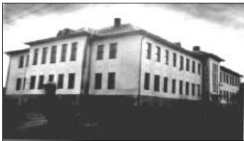
Želvos gimnazijos bendruomenės laikraštėlis