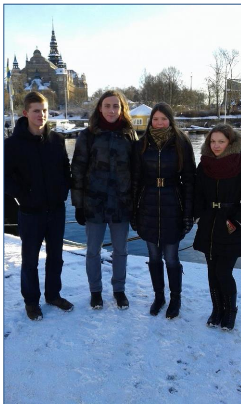
Mūsų dvyliktokai Stokholme (tolumoje – vienas iš Stokholmo muziejų)