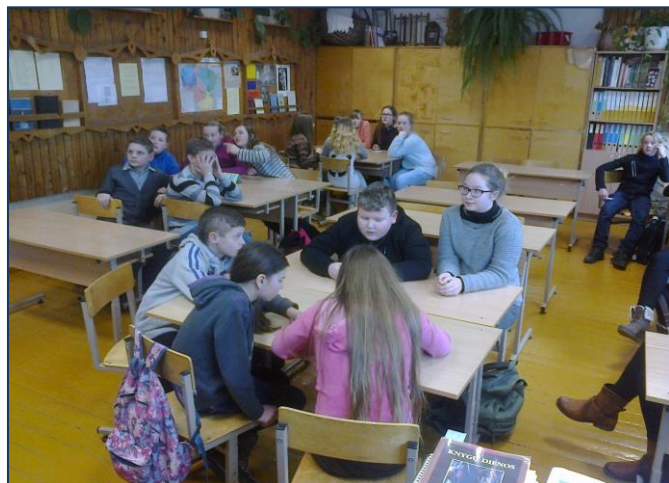
Varžomės žaidime „Moki žodį – žinai kelią“