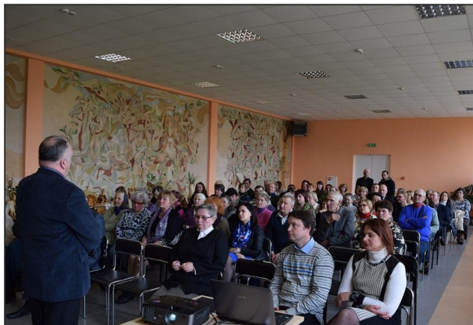
Į renginį susirinko tie, kuriems įdomi gimtojo krašto istorija

„Facebook“ paskyroje „Želvos bendruomenė“.