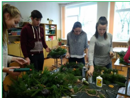
Pinami advento vainikai.