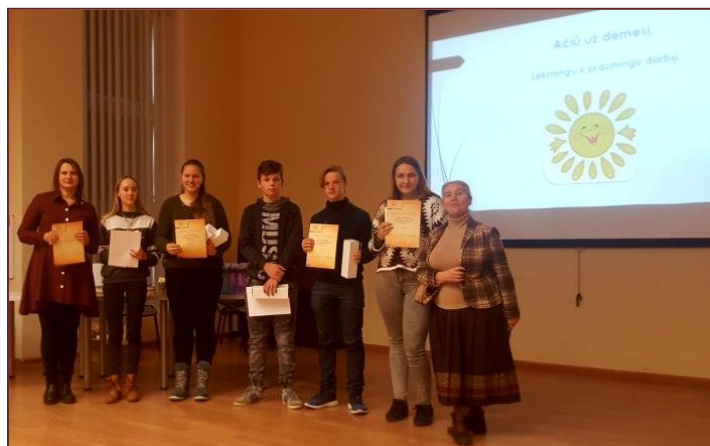
Su darbo vertintoja žinoma etnologe Gražina Kadžyte