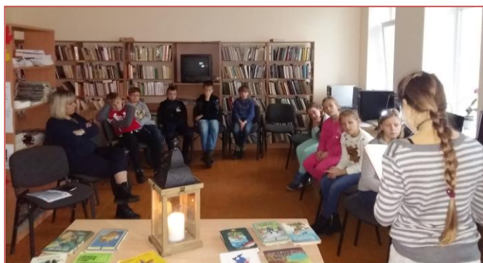
Renginio bibliotekoje akimirka

Kadangi šiemet Šiaurės šalių savaitės tema yra „Salos“, tai po ištraukos skaitymo mažiesiems skaitytojams buvo papasakota apie salas Šiaurės šalyse. Čia yra nesuskaičiuojama gausybė salų, nuo pačių mažiausių uolėtų šcherų iki didžiausios pasaulyje salos - Grenlandijos. Yra salų - valstybių, pavyzdžiui, Islandija. Salos tūkstančiais išsidėsčiusios palei Švedijos, Norvegijos ir Suomijos krantus. Todėl nieko keista, kad salos yra populiarius motyvus Šiaurės šalių dailėje, folklore, literatūroje. Rytinių skaitymų metu buvo kalbama ir apie vieną garsiausių Šiaurės šalių vaikų rašytoją Astridą Lindgren, kurios 110-ąsias gimimo metines šiemet minime. Kalbėjome apie rašytojos gyvenimą, meilę vaikams, skaitėme ištraukas iš jos knygų.