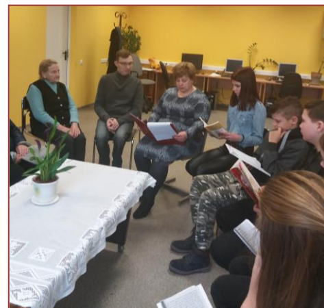
Knygos buvo skaitomos ir miestelio bibliotekoje