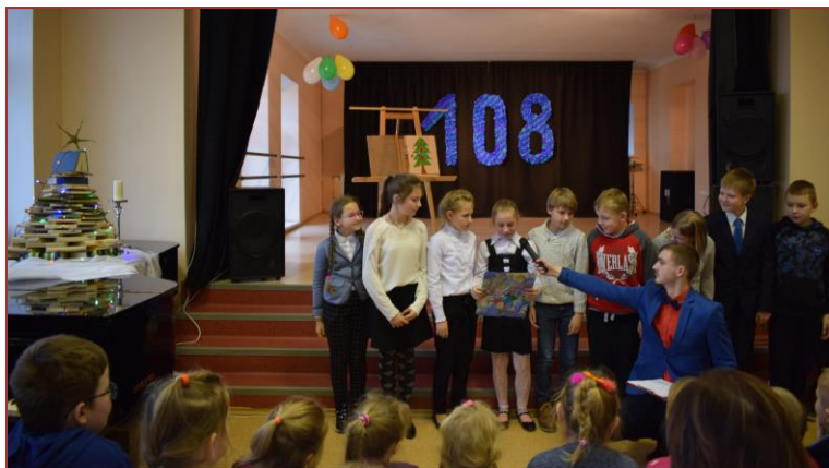
Pristatome savo sukurtas kalėdines pasakas