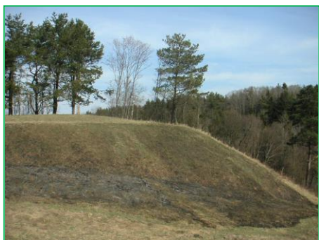
Nuotraukoje – Paželių piliakalnis

Pristatome NAUJIENĄ – leidinį „Dešimt turistinių maršrutų po Želvos kraštą“. Jūsų dėmesiui – vienas leidinio fragmentas. Gal bus įdomu.