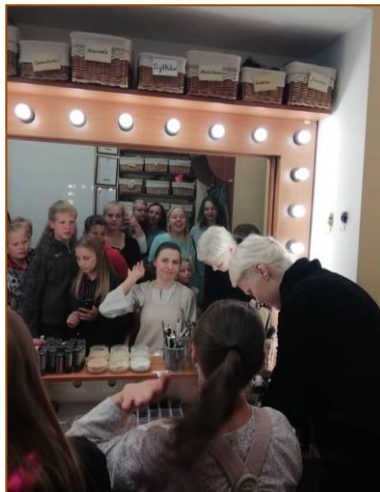
Mažajame teatre.

Įspūdžius papasakojo šeštokai, o užrašė mokytoja Rasa Povylienė