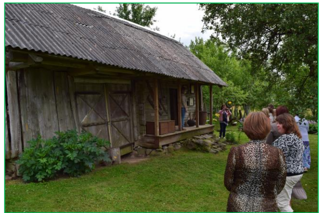
Dvareliškių kaimo muziejuje – prie klėtelių